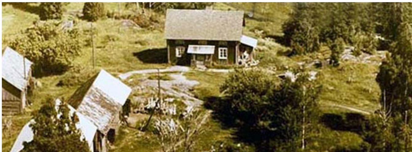
Eken, Byn. Foto 1958.