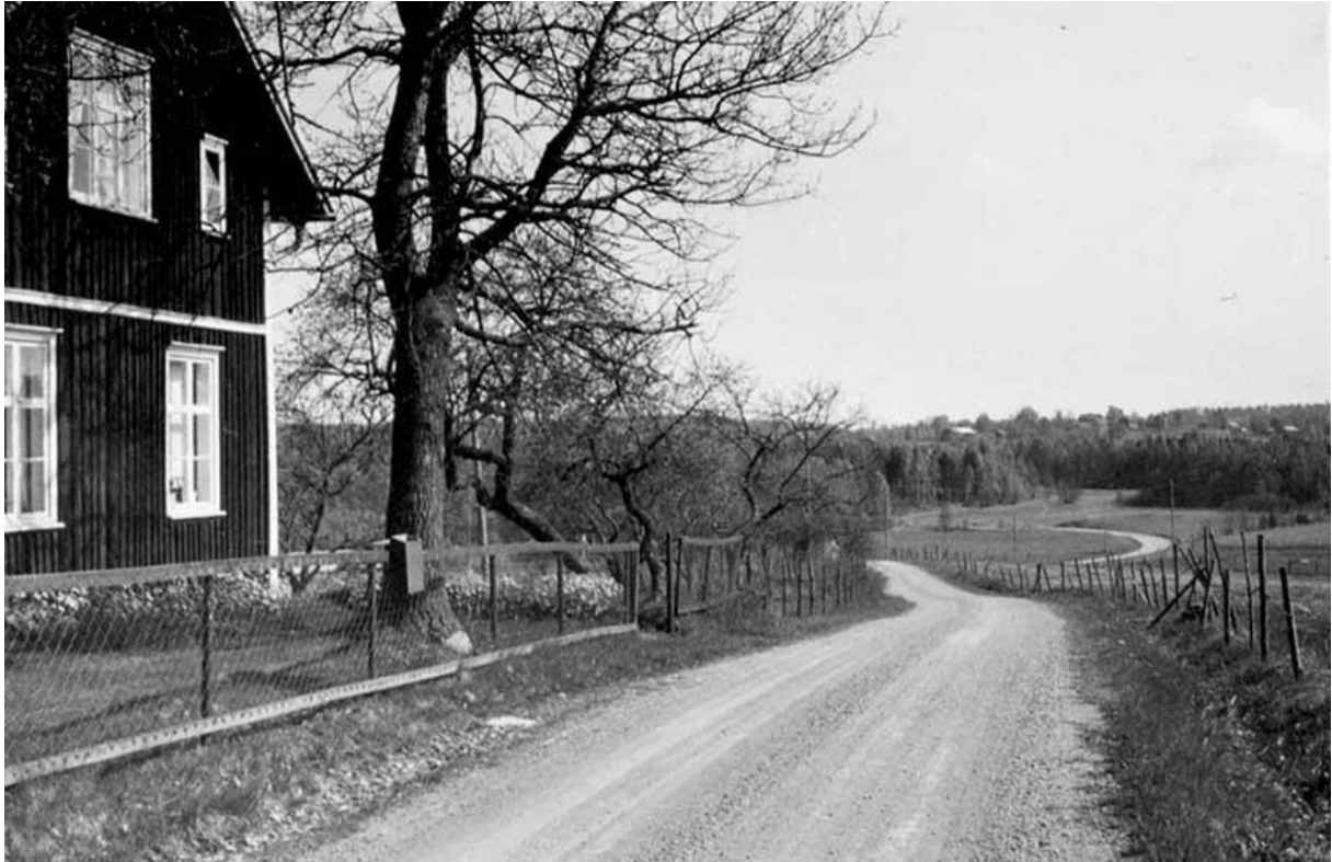
Vägen söderut förbi Nystugan, Dalen. På höjden i fjärran skymtar Byn.