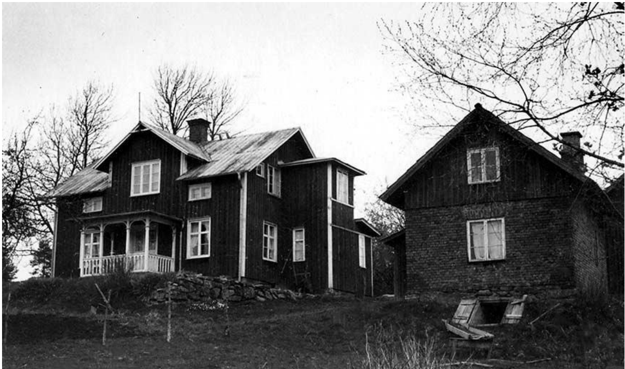
Nystugan, Dalen. (Eget foto 1967).

XXXXXXXXXXXXXXXXXXXXXXXXXXXXXXXXXXXXXXXXXXXXXXXXXXXXXXXXXXXX