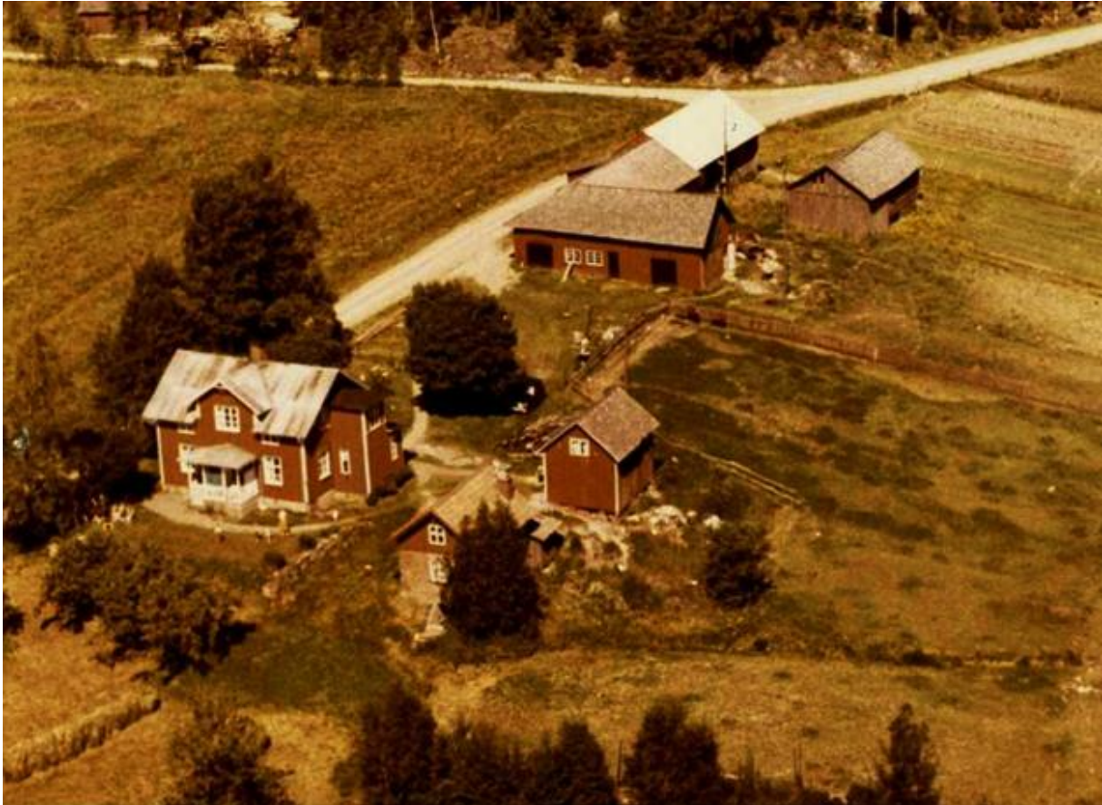
Nystugan, Dalen. 1958